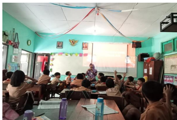
Gambar 2. Musyawarah kesepakatan kelas

Pertama, kegiatan kesepakatan kelas biasanya dilakukan ketika diawal masuk tahun ajaran sekolah. Apabila pada saat tertentu peraturan dapat ditambahkan oleh guru sesuai dengan situasi dan kondisi yang ada. Dalam manajemen kelas, guru memiliki wewenang untuk mengelola kelas baik fisik maupun non fisik (Fajri & Rivauzi, 2022). Peraturan yang diusulkan oleh guru akan disepakati bersama antara guru dan siswa. Kesepakatan tersebut dilakukan melalui kegiatan musyawarah.