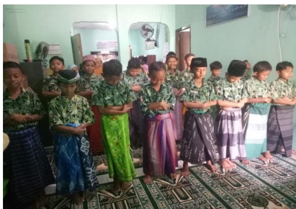
Gambar 4. Siswa melaksanakan salat zuhur pada saat jam pelajaran PAI

Dalam pembiasaan seperti memberikan salam sebelum masuk ke kelas, membaca doa sebelum dan sesudah belajar, membaca doa sebelum makan pada saat jam istirahat, membaca doa sesudah makan pada saat jam istirahat selesai, salat dhuha dan zuhur pada jam pelajaran Pendidikan Agama Islam (PAI) dan ketika ada kegiatan ekstrakurikuler merupakan pembiasaan dalam membentuk karakter religius siswa. Pembiasaan yang telah disebutkan tersebut mengandung elemen akhlak beragama pada dimensi beriman, bertakwa kepada Tuhan Yang Maha Esa, dan berakhlak mulia pada kurikulum merdeka. Akhlak beragama merupakan siswa sebagai pelajar Pancasila mengenal sifat-sifat Tuhan-Nya dan mendalami sifat-sifat Tuhan-Nya (Kemendikbudristek, 2022). Siswa menyadari bahwa sebagai makhluk yang diciptakan oleh Tuhan, ia memiliki tanggung jawab untuk memberikan kasih sayang bagi dirinya sendiri, sesama manusia dan lingkungannya serta melaksanakan perintah Tuhan dan menjauhi larangan-Nya.