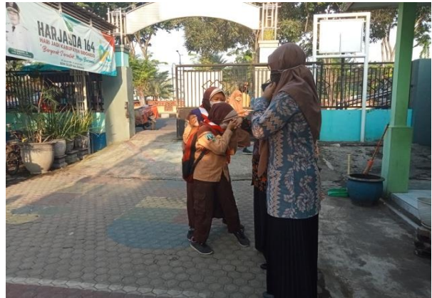
Gambar 3. Siswa memberi salam ke guru sebelum masuk ke kelas

religius adalah membiasakan siswa untuk melakukan salam sebelum masuk ke kelas. Ketika siswa datang, siswa akan memberikan salam kepada guru yang menyambutnya. Sebelum memulai jam pembelajaran siswa akan berdo'a bersama di lapangan.